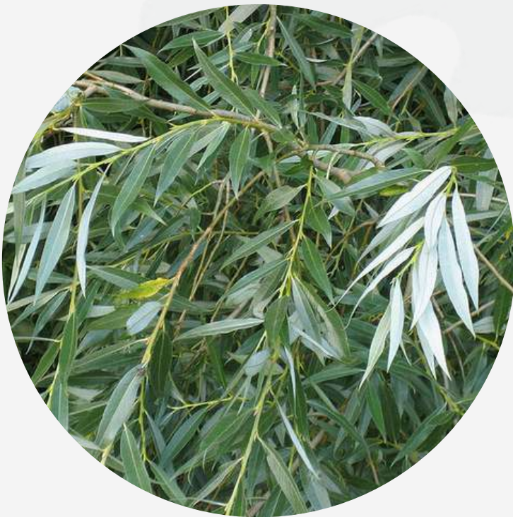
Saule blanc Salix alba

Le castor est herbivore et son régime alimentaire se compose d'écorces, de tiges, de bourgeons, de plantes aquatiques, de feuilles d'arbres et d'arbustes.