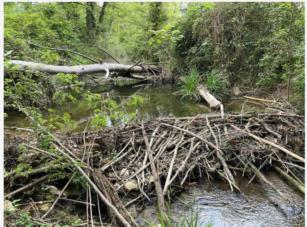
La Barrage du Castor dans un ruisseau en Ardèche

Dans certains cas, les retenues d'eau créées par le castor limitent la baisse du niveau des petits cours d'eau en période de sécheresse et favorisent l'infiltration de l'eau dans le sol.