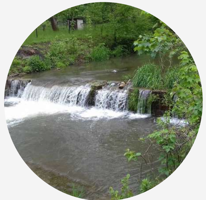
Seuil sur un cours d'eau